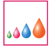
Piezo Variable Drop