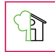
Outdoor / Indoor