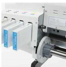
Atramenty i rozwijarka