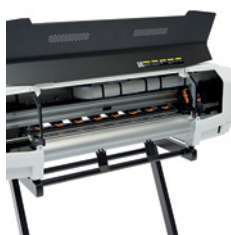
Łatwa obsługa i konserwacja