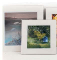
Obrazy i reprodukcje