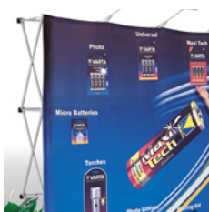
Ścianki, pajęczki, roll-upy