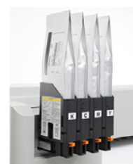
Atramenty UMS w workach