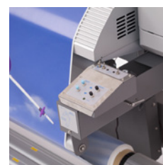
System prowadzenia mediów