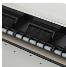
Rolki dociskowe na całej szer.