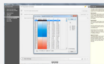
Bezpłatne filmy szkoleniowe na kanale ONYX